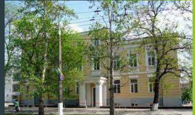
Херсон, Палац для дітей та юнацтва

Направлений інтерес створює сприятливу психологічну установку у відвідувачів і робить процес соціалізації ефективнішим. На такій основі базується дозвільна діяльність.